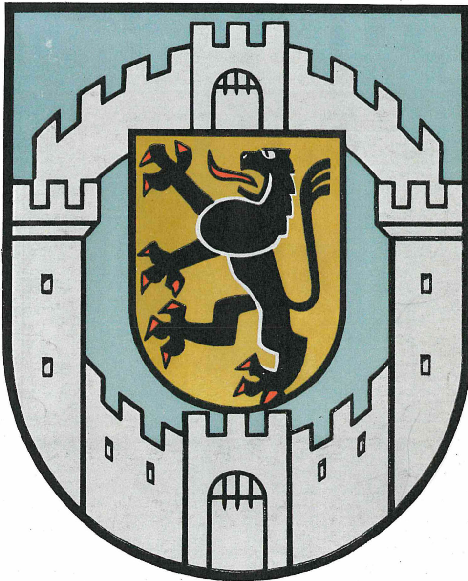
Wappen der Kreisstadt Bergheim