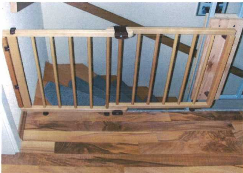
Abb. 2 Gesicherter Treppen- abgang

Treppen oder höher gelegene Stockwerke im Haushalt sind in der Regel mit Brüstungen, Geländern und/oder Handläufen versehen, die auf die Benutzung durch Erwachsene ausgelegt sind. Aufgrund der unterschiedlichen Körpergrößen ist es wichtig, auch die Belange der Kinder baulich zu berücksichtigen. Folgende Aspekte sind dabei zu beachten: