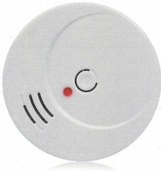
Abb. 4 Rauchmelder sind unverzichtbar

Zündquellen müssen entweder außerhalb der Reichweite von Kindern oder verschlossen aufbewahrt werden. Kaminöfen sind vor dem Zugriff von Kindern zu sichern, z. B. durch Schutzgitter. Kerzen oder sonstige offene Feuer dürfen nicht unbeaufsichtigt brennen. Um Brandrauch frühzeitig bemerken zu können, ist die Installation von Rauchmeldern unverzichtbar. Informationen zu Rauchmeldern im häuslichen Einsatz erhalten Sie u. a. auf der Website www.rauchmelder-lebensretter.de . Dort werden wertvolle Hinweise zur Absicherung Ihrer Wohnung oder Ihres Hauses mit Rauchmeldern, einschließlich Kauftipps, Montage- und Einsatzhinweisen von Rauchmeldern gegeben.