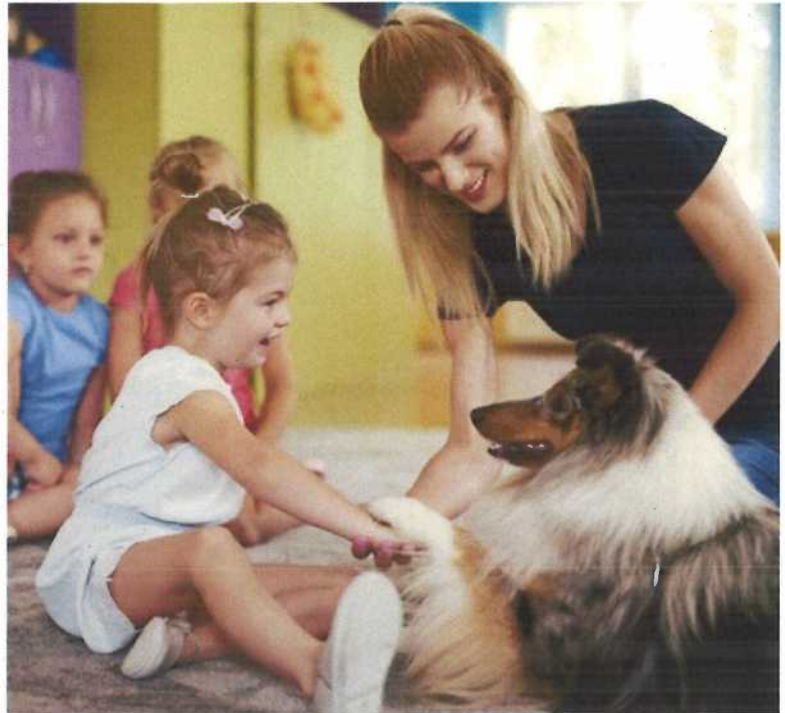
Abb. 8 Gemeinsames Ein- üben von Verhaltens- regeln im Umgang mit einem Hund

erschreckt, beim Fressen nicht gestört oder nicht in die Enge getrieben werden dürfen. Zudem sollten nachfolgende Maßnahmen Beachtung finden: