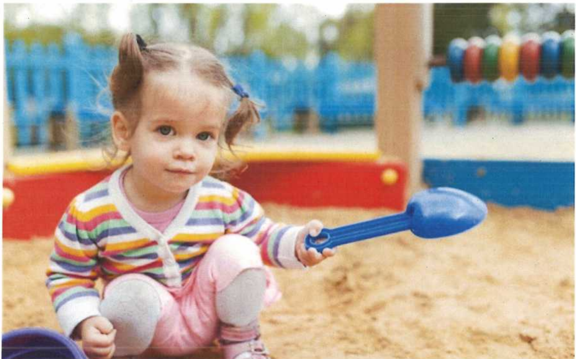
Abb. 11 Sandkästen vor Nutzung auf Verunreinigungen prüfen

Das Tragen von Kordeln, Bändern, Schals und Fahrradhelmen auf Spielplätzen und an Spielgeräten kann lebensgefährlich sein! Aufgrund der Strangulationsgefahr ist es unbedingt zu verhindern.