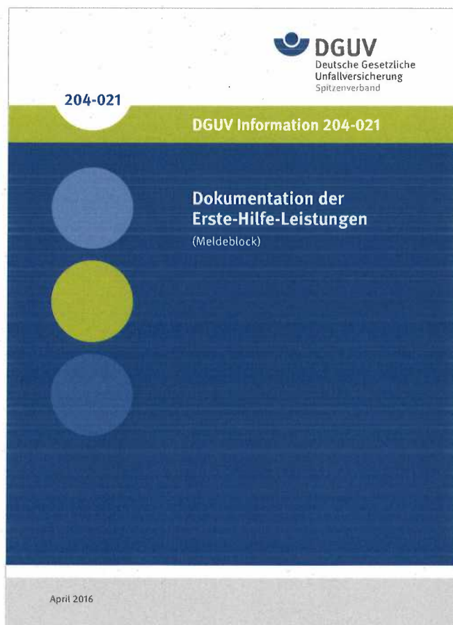
Abb. 14 Meldeblock zur Dokumentation von Erste-Hilfe-Leistungen

Unfallanzeigen und Meldeblock sind kostenfrei beim zuständigen Unfallversicherungsträger zu beziehen.