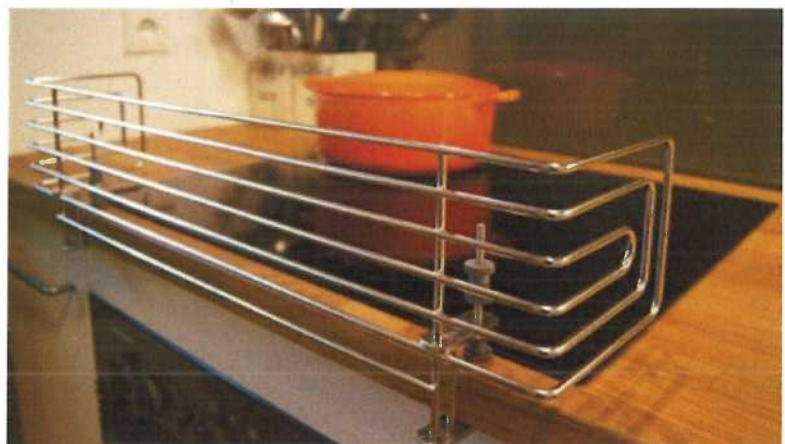
Abb. 10 Installation eines Herdschutzgitters

Auch siedendes Wasser im Wasserkocher oder die abgestellte Tasse mit heißem Kaffee auf dem Tisch stellen eine Verbrühungsgefahr dar.