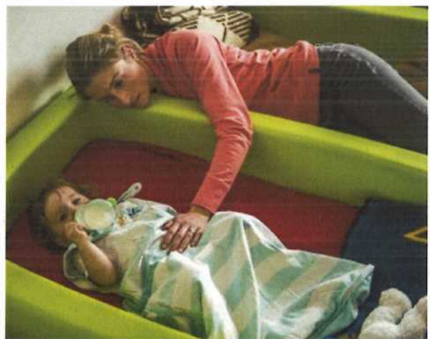
Abb. 9 Mögliche Gestaltung eines Schlafplatzes in der Kindertagespflege

Für jedes Tageskind sollte eine eigene Schlafgelegenheit zur Verfügung stehen. Die Schlafgelegenheit ist so platziert, dass das Kind keine gefährlichen Gegenstände wie z. B. Schnüre, Bänder oder Kabel erreichen