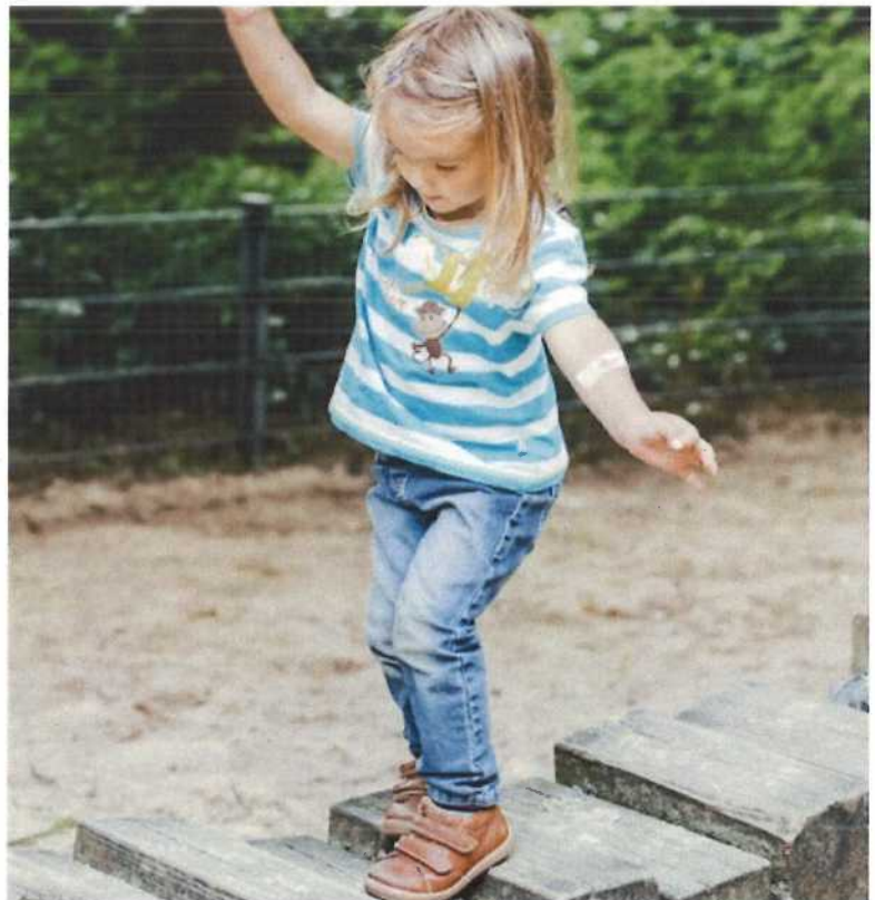
Abb. 1 Kinder sollten natürliche Bewegungsräume nutzen, bei denen sich Sicherheit und Risiko nicht ausschließen dürfen

Sicherheit“. Letztere soll vor allem verhindern, dass nicht kalkulierbare Risiken für Kinder zu einer ernsten Gefahr werden. Beispiele dafür sind in dieser Broschüre genannt. Eine kindgerechte und bewegungsfördernde Betreuungsumgebung trägt dazu bei, dass Kinder ihr natürliches Bewegungsbedürfnis ausleben können und hierbei die notwendige Risikokompetenz erwerben.