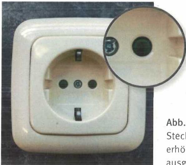
Abb. 5 Steckdosen müssen mit einem erhöhten Berührungsschutz (Shutter) ausgestattet sein

Der Einbau von Fehlerstrom-Schutzeinrichtungen verhindert maßgeblich lebensgefährliche Stromunfälle. Bei Neubauten müssen seit 2009 grundsätzlich alle Steckdosen-Stromkreise mit diesen ausgerüstet sein. Bei Bestandsbauten wird eine Nachrüstung empfohlen.