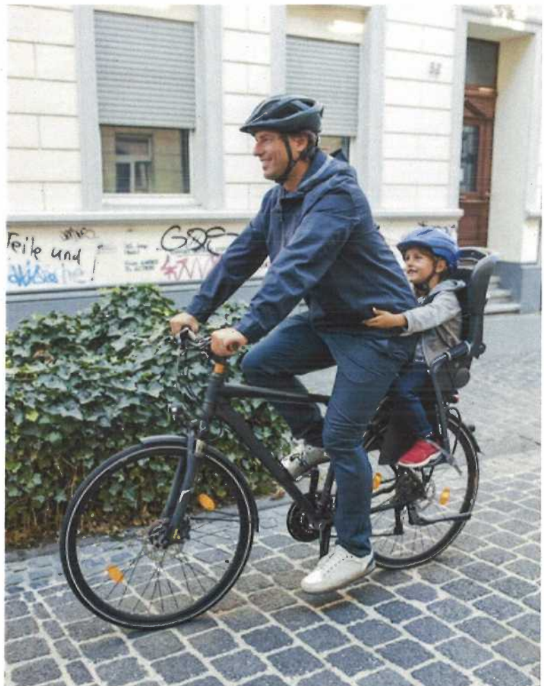
Abb. 12 Mitnahme des Kindes auf dem Fahrrad mit geeignetem Kindersitz und Fahrradhelm

Im öffentlichen Straßenverkehr sollte auf die Nutzung von Kinderfahrrädern verzichtet werden. Zur Mitnahme eines Kindes auf dem Fahrrad ist ein geeigneter Kindersitz oder Kinderanhänger erforderlich. Fahrradhelme sollten zwingend vom Kind und auch von den begleitenden Erwachsenen (Vorbildfunktion!) getragen werden.