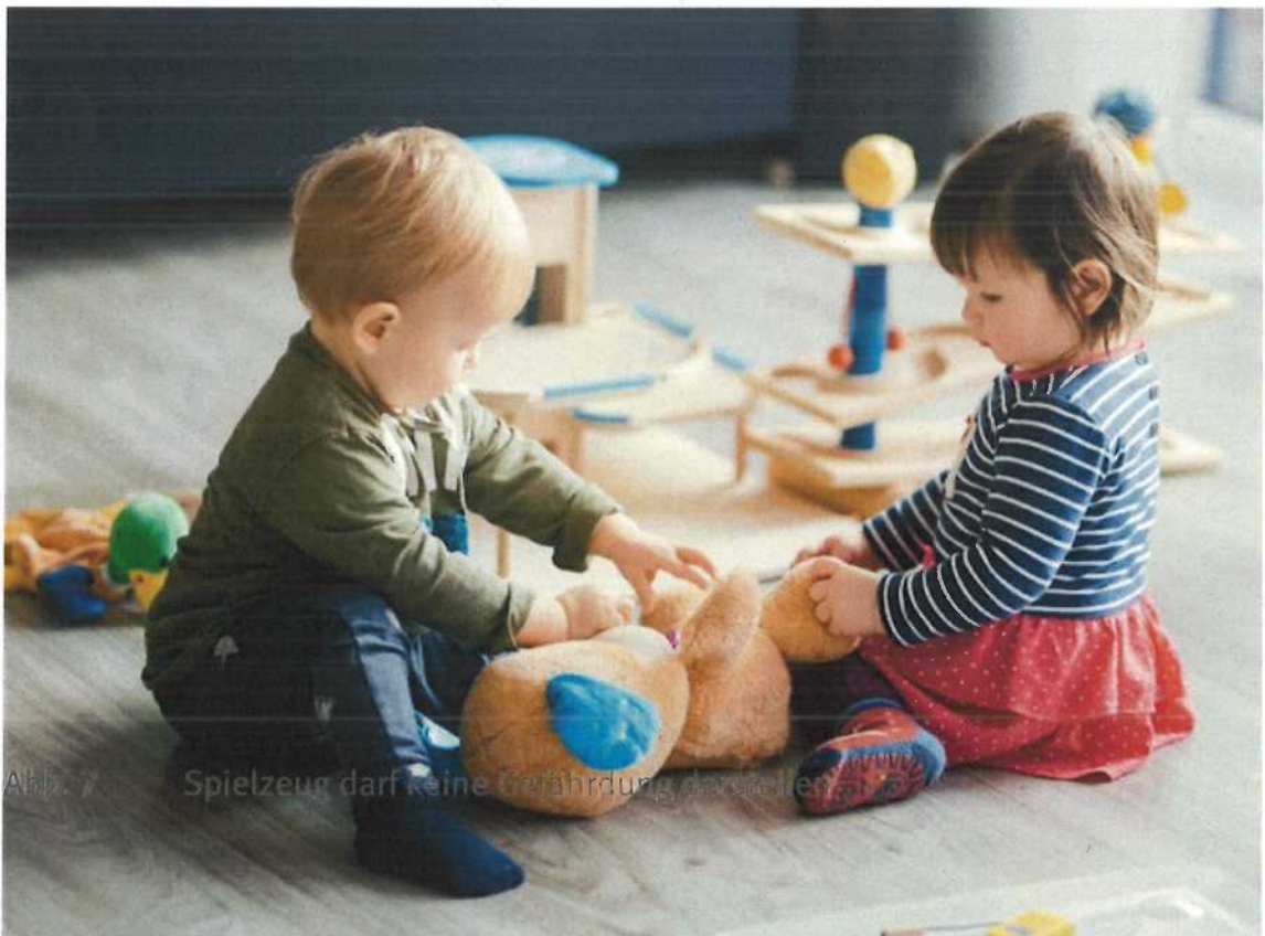
Abb. 7 Spielzeug darf keine Gefährdung darstellen

Bieten Sie Kindern unter 36 Monaten kein Spielzeug mit verschluckbaren (abnehmbaren) Kleinteilen an. Ähnliche Risiken können mit alltäglichen Gegenständen wie z. B. Nüssen (besonders Erdnüsse), Erbsen, Perlen und Münzen verbunden sein. Diese sind außerhalb der Reichweite von Kleinkindern aufzubewahren. Auch Einkaufstaschen, wie z. B. Plastiktüten, gehören nicht in den Zugriffsbereich von Kleinkindern, da die Gefahr besteht, dass das Kind darin erstickt, wenn es damit spielt.