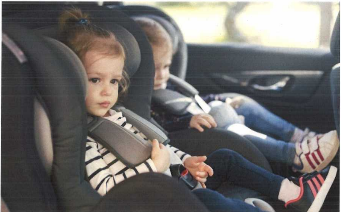
Abb. 13 Verwendung sicherer alters-, größen- und gewichtsgerechter Kindersitze im Auto

Kinder dürfen nicht alleine im Auto bleiben. Im Sommer besteht zusätzlich die Gefahr, dass sich der Innenraum eines Autos stark aufheizt. Schon nach wenigen Minuten droht ein Hitzschlag.