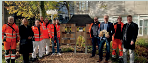
Einweihung des Bienenhotels vor dem Rathaus