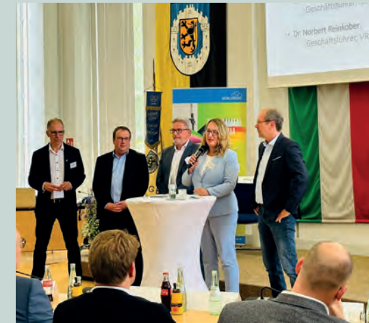
Vorstellung des Strukturwandel- Projektes Krafraum Shuttle