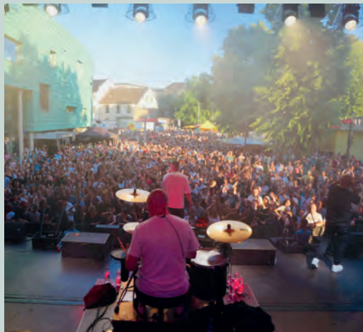
Summer in the City 2023