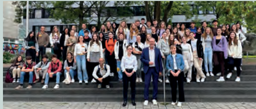
Bergheimer Schülerinnen und Schüler zu Besuch im Rathaus