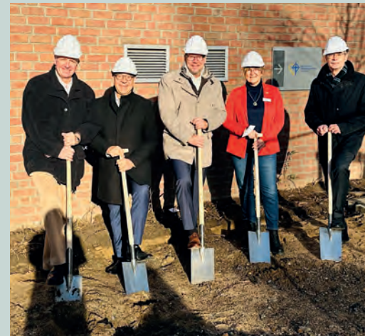
Spatenstich zur Erweiterung des Krankenhauses Bergheim