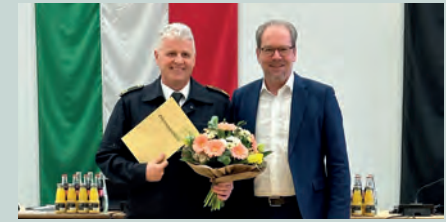
Wiederwahl des Leiters der Feuer und Rettungswache