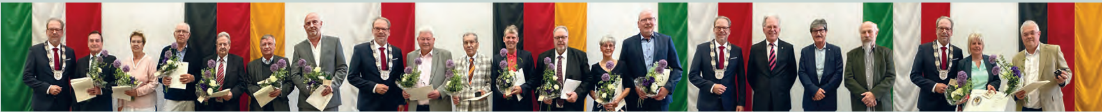
Ehrung besonderer Menschen aus Politik und Bürgerschaft