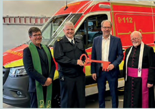
Einsegnung neuer Rettungsfahrzeuge