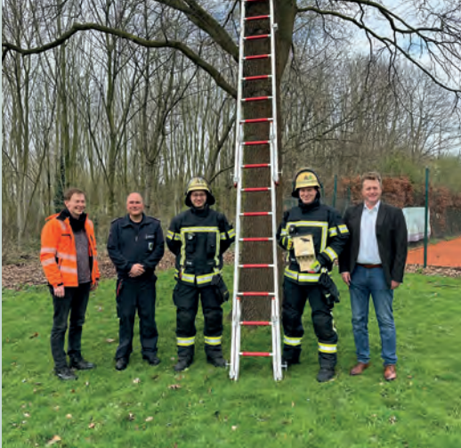
Fledermaus- und Meisenhäuschen