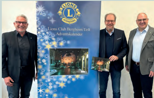
Adventskalenderaktion des Lions Club Bergheim