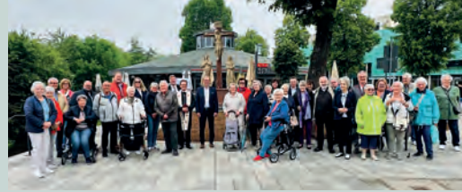
Einsegnung des Kalvarienberges