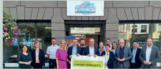
Eröffnung des Bildungslokals in Bergheim