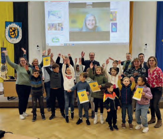
Übergabe der Kindermeilen an das Klimabündnis.