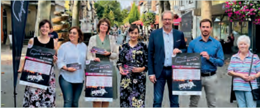
Bergheim Live 4 You 2023