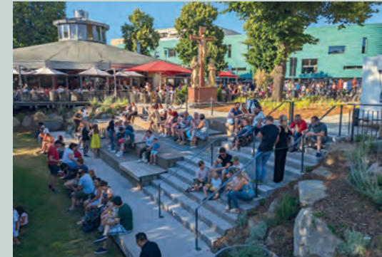
Treppen am Erftboulevard