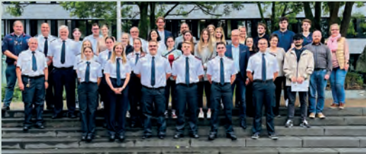
Aus- und Weiterbildung bei der Kreisstadt Bergheim