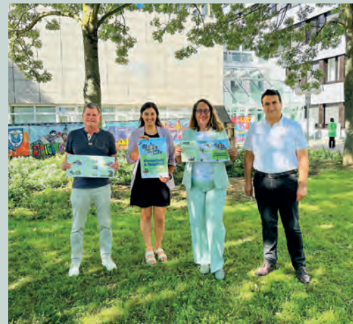
Klima- und Mobilitätswoche 2023