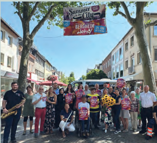
Bergheim Aktiv 2023