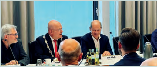
Der Bundeskanzler besucht das Rheinische Revier