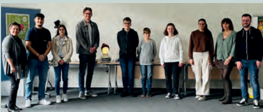
Girls und Boys Day 2023