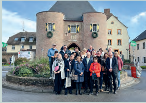
Besuch der Partnerstädte Andenne und Chauny