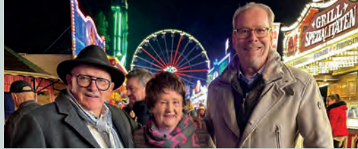
50jähriges Jubiläum des Organizers des Hubertusmarktes