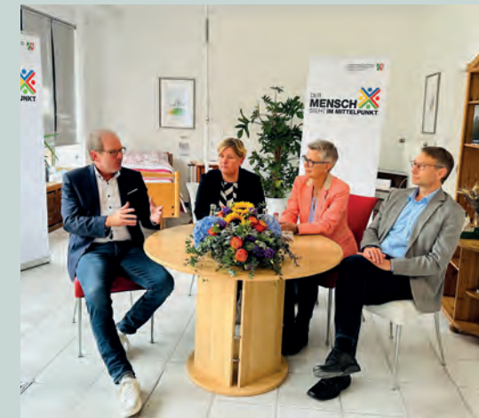
Landesbeauftragte für Menschen für Behinderungen zu Besuch in Bergheim ▲