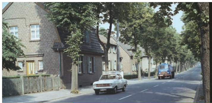
Die Ortschaft Fortuna

Die Bewohner mussten weichen und siedelten um. Anfang der 1970er Jahre begann der Verfall. Erst schloss das Kino, dann wurde 1978 der Bahnhof abgerissen. Nach und nach entwickelte sich das ehemals belebte Arbeiterdörfchen zur Geisterstadt. Am 27. April 1980 wurde in der Pfarrkirche St. Barbara die letzte Messe gefeiert. 1985 verließ der letzte Fortunese seine Heimat. In diesem Jahr fiel auch das letzte Haus: die Umkleidekabine der Fußballer am Sportplatz.