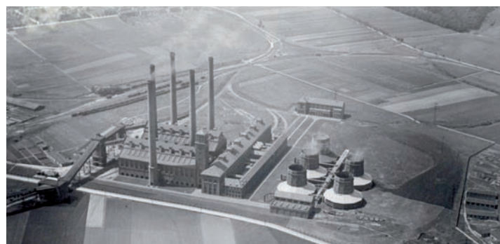
Das Kraftwerk Fortuna

Nach mehreren Erweiterungen bis in die 1960er Jahre hinein lag die Leistung des Kraftwerks bei 500 Megawatt. Noch bis drei Tage vor Weihnachten 1988 drehte sich die letzte Turbine im Kraftwerk Fortuna. Dann kamen die Bagger. Heute produziert ein Energiegigant wie das Kraftwerk Niederaußem 3700 Megawatt elektrischen Strom.