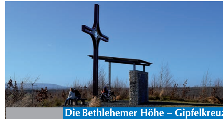
Die Bethlehemmer Höhe – Gipfelkreuz

Am Fuße des Hügels lag einst Fortuna, jenes Örtchen, welches alles hatte, was zu einem funktionierenden Dorf gehört und das ehemalige Einwohner als ersten „Multi-Kulti-Ort im Rhein-Erft-Kreis“ beschreiben, denn der Ort war ein Schmelztiegel der Nationen. Aus ganz Europa zogen die Menschen zu, um in der Brikettfabrik und im Kraftwerk Fortuna zu arbeiten.