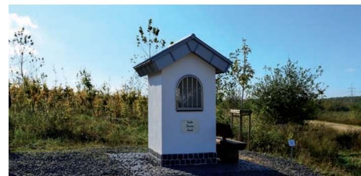
Der Bildstock „Rette Deine Seele“