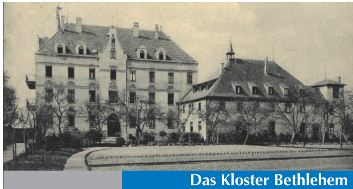
Das Kloster Bethlehem

Von wunderbaren Krankenheilungen berichten die Urkunden des klösterlichen Archivs schon 1598, als rund um Bergheim die Pest wütete. Damals stand nur eine Kapelle dort, wo Franziskaner im 17. Jahrhundert ein Kloster gründeten. Mitte des 18. Jahrhunderts strömten Jahr für Jahr bis zu 40.000 Pilger zum ehrwürdigen Gemäuer im Wald östlich von Bergheim. Düsseldorfer hätten im Kloster Heilung erfahren, Viehseuchen nahmen ab, notierten die Chronisten. Nach Übernahme des Rheinlandes durch die Franzosen fiel das Kloster an den Staat und wurde 1802 aufgelöst. Ende des 19. Jh. erwarb die „Genossenschaft der Barmherzigen Schwester von der Heiligen Elisabeth zu Essen“ die Gebäude und gründete ein Pensionat und Erholungsheim. Im Zweiten Weltkrieg nutzten erst deutsche Soldaten, nach dem Krieg amerikanische Streitkräfte das Gebäude. 1953 zeichnete sich bereits ab, dass das Gelände der Braunkohle weichen musste. Im April 1966 verließen die letzten Ordensschwester das Kloster, das 1967 abgerissen wurde. Ein mystischer Ort verschwand. Geschichten über Tod und Teufel, Pilger und Schurken ranken sich noch heute um das untergegangene Gemäuer.