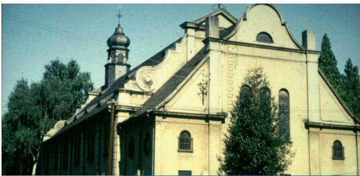
Die Pfarrkirche St. Barbara

Vielen Hochzeiten, Taufen und auch Beerdigungen gab das Gotteshaus einen würdigen Rahmen. Doch Anfang der 1980er Jahre war Schluss: Die Kirche musste dem Tagebau weichen. Nur der kleine Glockenturm kann heute noch besichtigt werden. Er wurde am 23. November 1982 abmontiert und als Erinnerung vor der Kirche St. Vinzentius in Oberaußem wieder aufgebaut. Die beiden Glocken sind etwas besonderes, sie stammen aus älteren Kapellen: Eine aus der Kapelle der Grube Clarenberg von 1612 und die andere aus der Grube Fortuna aus dem 18. Jahrhundert.