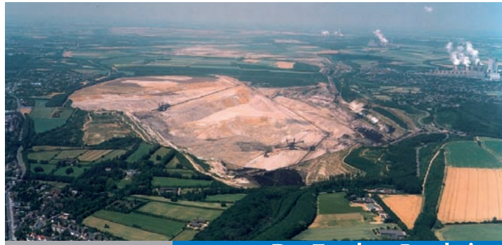
Der Tagebau Bergheim

Der Aufschluss des Tagebaus Bergheim begann Anfang der 1970er Jahre. Das „Loch“ war drei Kilometer lang, zwei Kilometer breit und 100 Meter tief. Von 1984 bis 2002 wurden dort 546 Millionen Kubikmeter Abraum bewegt und 238 Millionen Tonnen Kohle gefördert. Heute ist ein sieben Quadratkilometer großes Naherholungsgebiet entstanden, das von rund 40 Kilometern Rad- und Wanderwegen durchzogen ist.